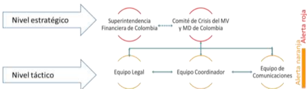
Gráfico 1 - Estructura de Gobierno

En los órganos de gobierno participan los funcionarios designados por cada uno de los proveedores de infraestructura que son parte de este Protocolo. Según lo estimen necesario o conveniente, los órganos de gobierno del Protocolo podrán invitar a personas externas, asesores, o representantes de terceros, incluyendo los MAPs.